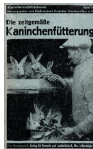
Abb. 6: "Die zeitgemäße Kaninchenfütterung" von Martin Gadsch aus dem Jahr 1944Von Gadsch, 1944 19) wurden als Unkräuter für die Kaninchenfütterung Hasenkohl (Gemeiner Rainkohl), Hirtentäschelkraut, Klebkraut, Klette, Ochsenzunge, Schöllkraut, Spörgel (Spark), Hahnenfuß, Brennnessel, Rainfarn, Beifuß, Ackerdistel, Kälberkropf, Hundskamille, Bienen-saug (Weiße Taubnessel), Frühlingskreuzkraut (Sencio vernalis), Gänsefingerkraut und Grindampfer (Stumpflättriger Ampfer) aufgeführt.

Joppich, 1946 20) führte folgende Futtermittel für die Kaninchenzucht auf: