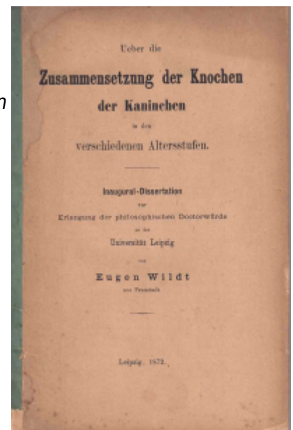
Abb. 3: Wildt, 1872 Ziel der Dissertation des Apothekers E. Wildt aus dem Jahr 1872 war es, mittels neuerer, genauerer Analysemethoden „ein möglichst vollständiges Bild von der Zusammensetzung der Knochen ein und desselben Thieres in den verschiedensten Altersstufen zu entwerfen“. 1)