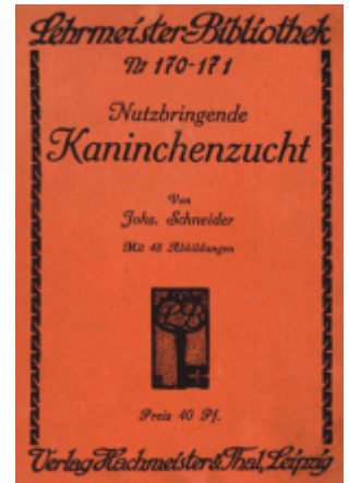
Abb. 4: "Nutzbringende Kaninchenzucht" von Schneider, J.; 1930 12) unterschied drei Fütterungsarten: