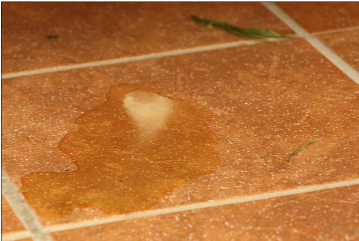
Bild: Überflüssiges Calcium wird vom Kaninchen überwiegend mit dem Urin ausgeschieden. Besonders nach der Aufnahme größerer Mengen frischer Kräuter sind häufig calciumhaltige Urinflecken finden.

Die Regulierung des Calcium-/Phosphorhaushalts (Homöostase) beeinflusst den Knochenumbau und somit auch die Knochendichte. In der Literatur finden sich sehr viele Ergebnisse aus Versuchen mit wachsenden Kaninchen, die sich auf erforderliche Calciummengen beschränken. Mindestens genauso wichtig ist aber das Verhältnis von Calcium zu Phosphor: wenn Phosphor gegenüber Calcium überwiegt, das Verhältnis von Ca:P also > 2:1 ist, versucht der Organismus, das physiologische Gleichgewicht wieder herzustellen. Zu diesem Zweck muss das erforderliche Calcium aus den Knochen mobilisiert werden, was zu einer Verringerung der Knochendichte führt. Dieser Effekt ist an den Werten im Blutserum nicht unbedingt erkennbar. Weitere Probleme sind Ablagerungen von Calciumphosphat in Blutgefäßen und Geweben sowie eine reduzierte Aufnahme von Calcium im Darm. Ein weiterer Mechanismus der Regulierung ist die Konstanthaltung des Ionenprodukts im Plasma.