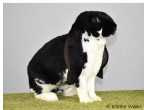
Abb. 4: Englischsches Widderkaninchen (Weibchen), mantelgescheckt, schwarz-weiß. Bundessieger 2019Im Zuchtstandard des ZDRK, 2018 34 ) wird die Behanglänge und deren Bestimmung folgendermaßen beschrieben: „Die Behanglänge ist mit dem Zollstock über dem Kopf des Tieres von einer Spitze zur anderen zu messen. Dabei werden die Ohren mit der Schallöffnung nach vorne und ohne Drehung an den Zollstock angelegt. Die Ohren sind bei der Messung leicht anzuziehen. Die Behanglänge beträgt 54 bis 60 Zentimeter.“ ... „Die Breite der Ohren wird in der Mitte des Behanges

Es sind keine Untersuchungsergebnisse bekannt, die eine besondere Verletzungsgefahr bei Ohren von Kaninchen der Rasse „Englische Widder“ bestätigen würden. Prinzipiell sind Ohren bei Wildkaninchen verletzungsanfällig, ebenso wie bei Hauskaninchen in Gruppenhaltungen.