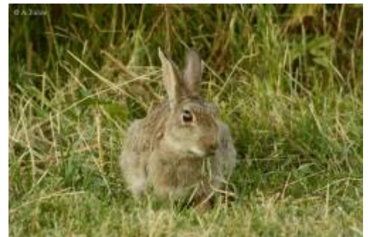
Abb. 3: Wildkaninchen frisst Weidelgrasblätter und -samen (Lolium perenne) Das Wildkaninchen ist ursprünglich aus Asien nach Europa eingewandert , wurde während der Eiszeiten bis nach Spanien und Portugal zurückgedrängt und ernährte sich immer vorwiegend von Gräsern und Kräutern. Heutige Berichte von Wildkaninchen auf entfernten Kontinenten oder Inseln gehen immer auf deren Ansiedelung durch den Menschen dort zurück. Dadurch war es gezwungen, sich an dortige Gegebenheiten anzupassen.

Nicht immer war die Ansiedelung in fremden Lebensräumen von Erfolg gekrönt. Das heißt, die Anpassungsfähigkeit (Elastizität) des Organismus des Kaninchens hat seine Grenzen. Es gibt z. B. Berichte über das Fressen von Tang auf den Kerguelen 1) , allerdings zahlt das Kaninchen dafür einen hohen Preis, denn nur 10% der Populationen dort überleben strenge Winter.