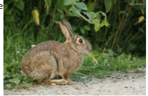
Abb. 4: Wildkaninchen frisst Grassamen Auch in Australien wurde das Kaninchen durch den Menschen eingeführt. Je nach den dortigen Bedingungen gelang ihm die Ausbreitung. Tatsächlich hat ihm der Mensch die Möglichkeit geschaffen, in entfernte Gebiete vorzudringen, indem er Weideflächen für Schafe und Rinder schuf. Damit stellte er auch dem Wildkaninchen die Nahrung zur Verfügung, die sein Überleben und die weitere Ausbreitung ermöglichte. Erste Ansiedelungsversuche in Neuseeland und Australien schlugen nämlich fehl - weil die arttypische Nahrung fehlte.

Der Gymnasiallehrer Schäfer schrieb 1844 über Wildkaninchen in Rheinland-Pfalz zu seiner Zeit: „Die Kaninchen sind listig und vorsichtig, von scharfen Sinnen, und vermehren sich stark. [...] und thun daselbst großen Schaden an den Futterkräutern und der jungen Fruchtsaat.“ (2)