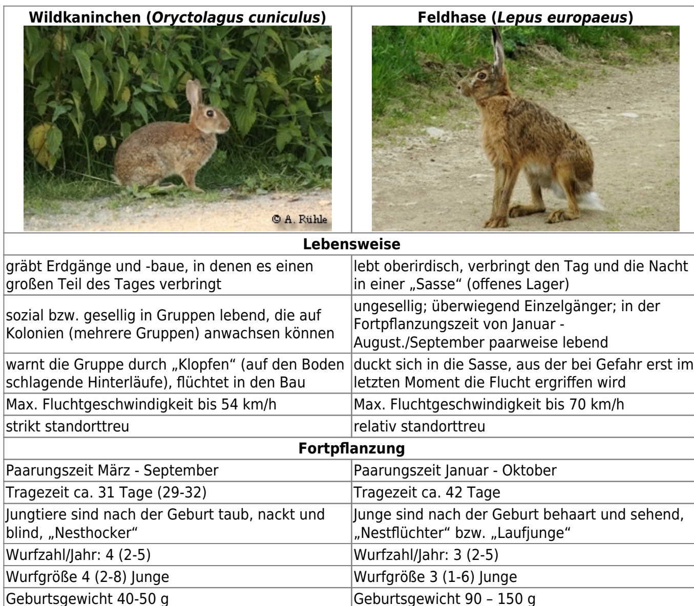
Tabelle 2: Vergleich einiger Merkmale von Wildkaninchen ( Oryctolagus cuniculus ) und Feldhase ( Lepus europaeus ); aus (Angermann, 1972) 1) , (Nachtsheim, et al., 1977) 2) , (Leicht, 1979) 3) , (Gibb, et al., 1994) 4) , (Bensinger, 2002) 5) , (von Holst, 2004) 6) , (Pegel, 2005) 7)

Das Wildkaninchen wird oft mit dem Feldhasen ( Lepus europaeus ) verwechselt. In der folgenden Tabelle sind Unterschiede zwischen den beiden Arten aufgeführt.